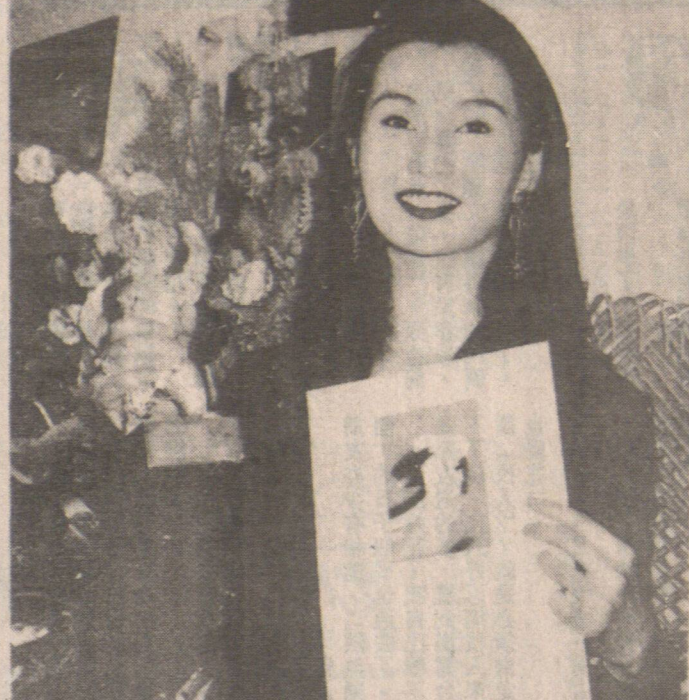
放怒花心座獎捧手玉曼張

【本報記者採訪】著名演員張冲日前在台北舉行婚禮，迎娶了多年來的伴侶。婚禮現場氣氛熱烈，眾多嘉賓到場祝賀。張冲在婚禮上表示，他對妻子的愛意從未改變，並感謝眾人的支持。張冲在婚禮上表示，他對妻子的愛意從未改變，並感謝眾人的支持。