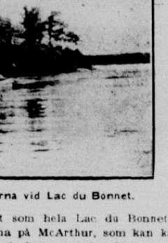
Johansons Point, en af de vackraste uddarna vid Lac du Bonnet.

Winnipeg river förlagen i området mellan Winnipeg och Lac du Bonnet. Det är ett vackert område med många vackra utsikter.