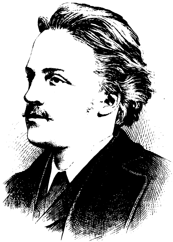
SON EXCELLENCE LE MARQUIS DE LORNE