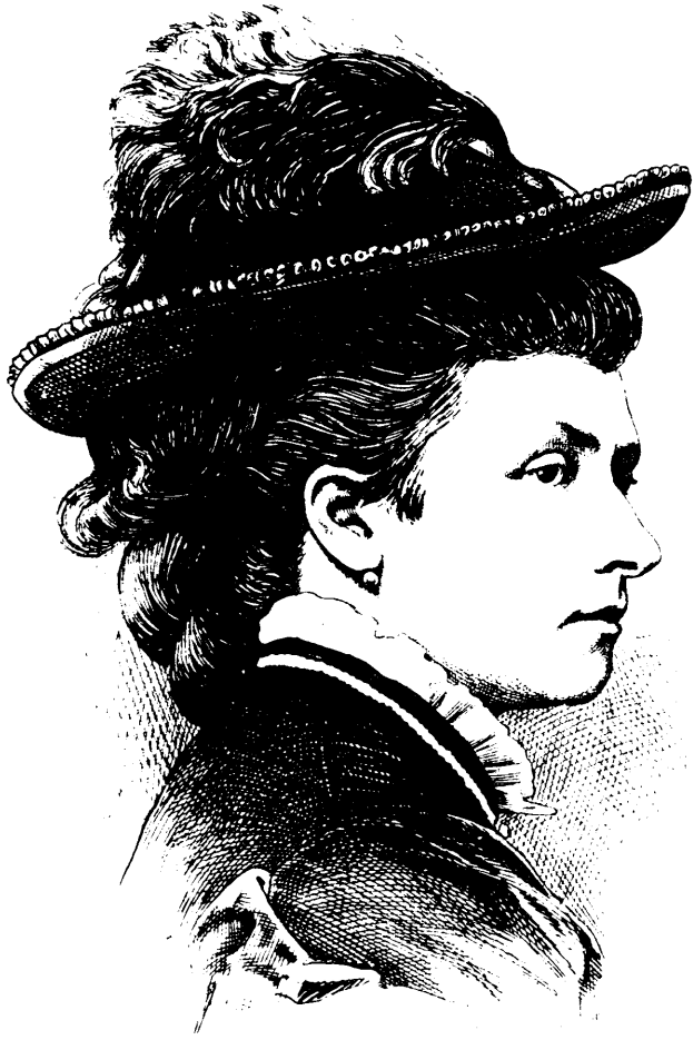
S.A.R. LA PRINCESSE LOUISE