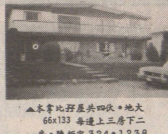
▲本拿比子屋四伙。地大 66x133 每連上三房二房。陳炬宏 324-1238

▲抵買柏文近西十街及甘比街。價五萬三千。 ▲抵買柏文近片打街二房。一千尺。價六萬餘。 陳炬宏 324-1238