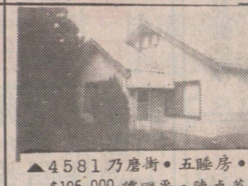
▲4581 乃磨街。五睡房。$106,000 譚國平。陳卓華