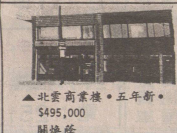
▲北雲商業樓。五年新。$495,000 關煥隆