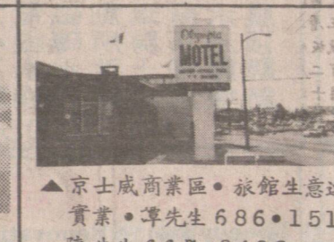
▲京士威商業區。旅館生意連實業。譚先生 686-1515 陳先生 667-8488