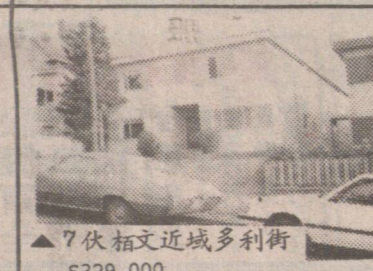
▲7伙柏文近域多利街 $329,000

商業樓 $275,000 7791 KINGSWAY 49x125 $225,000 3127 KINGSWAY 33x105 $275,000 141 E BROADWAY 50x200 $500,000 關煥隆