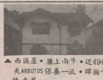
▲西區屋。樓上兩房。近 49 街夾 ARBUTUS 保養一流。譚國平 陳卓華。