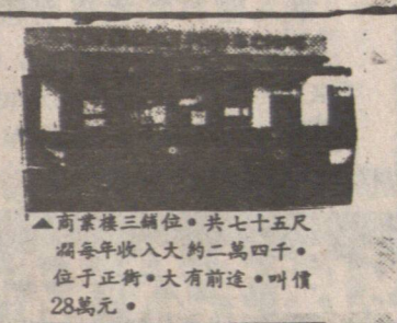
▲商業樓三層位。共七十五尺。每年收入大約二萬四千。位於正街。大有前途。叫價 28萬元。