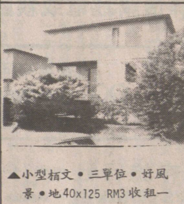
▲小型柏文。三單位。好風景。地 40x125 RM3 收租一流。佐治東街。隔鄰一座亦出售。趙崇淦。陳菲立。