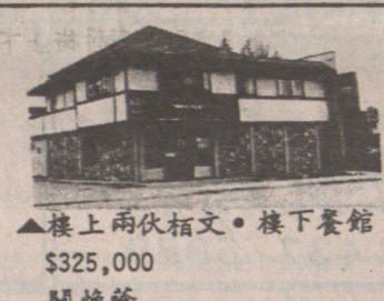
▲樓上兩房柏文。樓下餐館 $325,000 關煥隆