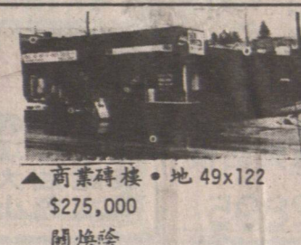
▲商業磚樓。地 49x122 $275,000 關煥隆