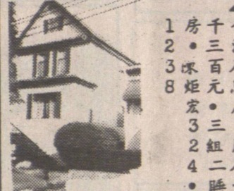
1房千合 2三法 3百入 8炬元 宏屋 三三 2租月 4二入 睡一

▲列治文兩層屋地 1.95 畝。樓下租出另有大菜園入息 $269,000 列治文兩層屋樓下租出 $163,000 葉太: 272-1861 住宅 273-3161 公司