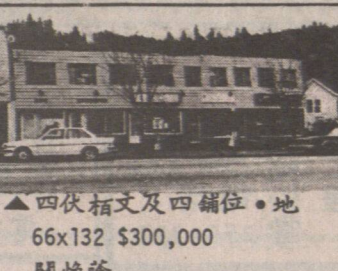
▲四伙柏文及四舖位。地 66x132 $300,000 關煥隆