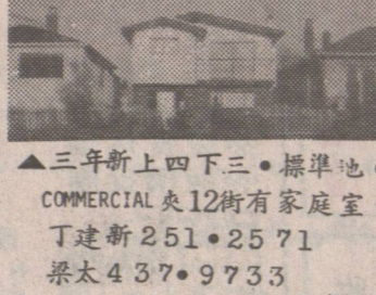
▲三年新上四下三。標準地。COMMERCIAL 夾 12 街有家庭室。丁建新 251-2571 梁太 437-9733

平!平!平! ▲東區一房一廳柏文。位於四樓。有電梯三萬餘元。試運價。梁太 437-9733 丁建新 251-2571