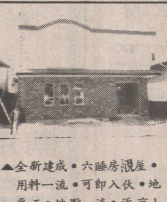
▲全新建成。六睡房兩層。用料一流。可即入住。地平整。地點一流。近京士威士33街。叫價十八萬餘。地址 5065 CAMBERS ST. 陳菲立。趙崇淦。