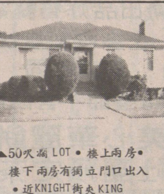
▲50呎闊 LOT。樓上兩房。樓下兩房有獨立門口出入。近 KNIGHT 街及 KING EDWARD 全層雙層玻璃。叫價十二萬餘。趙崇淦。陳菲立。