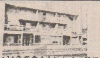
▲14年新雲東士紐柏文四間舖 地大65x120 DON QUAN 438-8161

住宅電話: 420-4665 唐人街中心商業樓 片打街東有25尺或50尺之商業樓出售。叫價由一百萬元起。詳細情形請電話謝煜賢 (DON QUAN) 438-8161 420-4665 ▲本拿比華埠餐館 125 座位 廚房用具設備齊全。叫價 $98,000