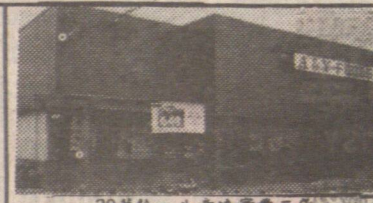
▲39萬餘。生意連實業三年新。四千尺。泊車場。由雲東去大約40分鐘。ALDERGROVE.

1) 列治文位於 No. 3 RD. 有 180 座位 $148,000 2) 本地比華利餐館 125 座位廚房用具。$98,000 設備齊全 3) 雲東 FRASER 街。座位一百 $148,000 4) PIZZA 餐館兩間位於本地比華利。只售兩萬餘君四萬餘。