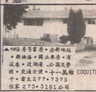
▲四房兩層房。全新地。新油漆。獨立車房。有後院。近湖邊。公園及學校。交通方便。十一萬餘 COQUITLAM 十。雷太 277-7375 住宅 273-3161 公司

柏文單位出賣 ▲正層睡房柏文位於烈治文。近公園巴士。保養費包暖氣。桑拿。價五萬九千。