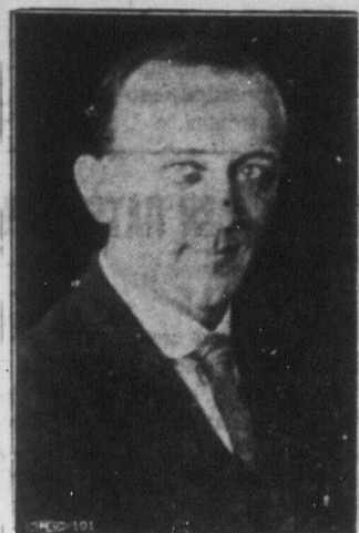
ВІЛІАМ З. ФОСТЕР.

Підчас страйку половину платні робітникам мають виплачувати промисловці, а половину правительство.