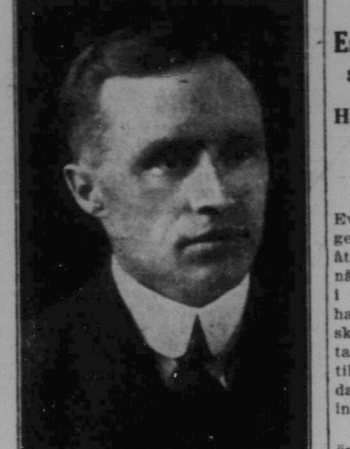
Hon. James G. Gardiner, vilken utfört ett jättearbete i och för provinsens landsvägsstaten.