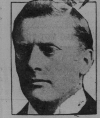
Winston Churchill, Frankrikes speciella vän och broder.

Prämiärminister King, vars regering vunnit en ny seger.