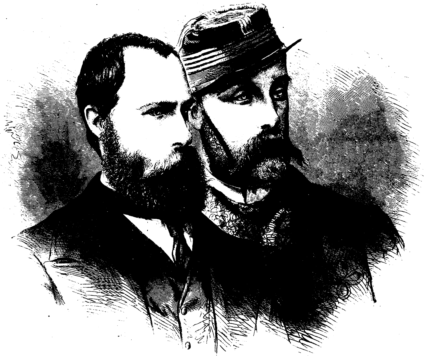
LE COMTE DE PARIS ET LE DUC DE CHARTRES.