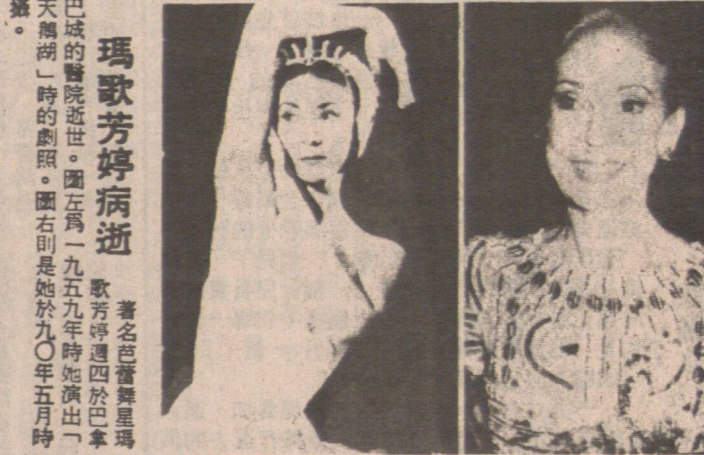
瑪歌芳婷病逝 瑪歌芳婷於一九九〇年五月時在洛杉磯病逝。

【本報訊】據一項調查顯示，在東京地鐵上，每五個乘客中，就有一人是女性。在東京地鐵上，每五個乘客中，就有一人是女性。在東京地鐵上，每五個乘客中，就有一人是女性。