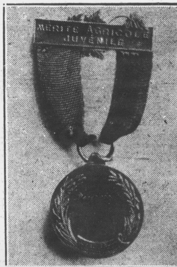
Médaille des Lauréats du Mérite Agricole des Jeunes cultivateurs

Un Gascon, qui avait une jambe plus courte que l'autre, boitait si bas, qu'on pouvait croire qu'à chaque pas il faisait une révérence. Il traversait l'allée d'un jardin où beaucoup de gens de sa connaissance étaient assis sur des bancs des deux côtés.