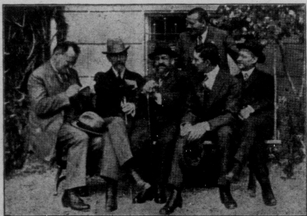
ДЕЛЕГАЦІЯ РАДЯНСЬКИХ РЕПУБЛІК В ГЕНУІ. (Від лівої руки до правої: Літвінов, Вороський, Плоффе, Вовоський, Новіцький і Сізіякін.)

Харківський "Комуніст" пише про подорож Пласудского до Румунії: "Подорож Пласудского до Бухарешту є пригладкою, шоби радянська влада мала ся на осторожності і була пригатована до відбитя наступу. Червона армія стоїть на поготілю для оборони своїх границь. Вона має повну забезпечку всіх сил робітничо-селянської держави".