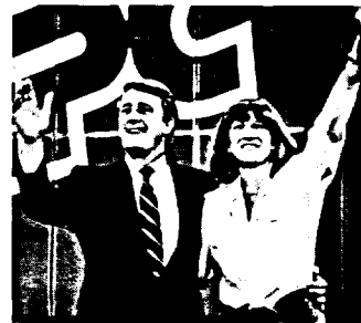
Brian et Mila Mulroney après avoir gagné les élections.

Mul-RO-ney ou Mu-RO-ney? Quelle est la bonne prononciation, puisque l'intéressé accepte les deux. La première est la prononciation anglaise, l'autre, la française. Quelle est celle qu'il préfère? Dans sa sagesse, il a préféré ne pas répondre.