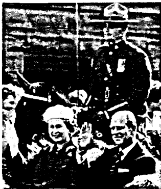
La Reine Elizabeth et le Prince Philip.

Les nouveaux produits continuent d'arriver sur le marché même si, selon les statistiques, 80 % d'entre eux sont voués à l'échec. Parmi les quelques réussites, mentionnons : Les électroménagers parlants Depuis quelques années déjà, Inglis offre une machine à laver parlante et Whirlpool, sa succursale américaine, vient de concevoir un réfrigérateur doué lui aussi de la parole. (Si vous en laissez la porte ouverte, il ne tardera pas à vous le faire savoir.) General Electric a l'intention de lancer un système d'ordinateur qui permettra de contrôler tous les appareils électriques à distance. Grâce au seul "gardien", branché sur n'importe quel type de télévi-