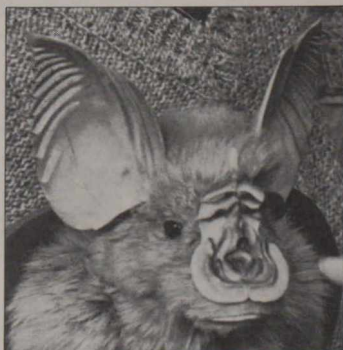
Modèle agrandi de la chauve-souris dite "fer à cheval".

■ Connaissance de la chauve-souris. Les chauves-souris sont des souris volantes, elles sont aveugles, elles s'agrippent aux cheveux, elles se nourrissent de sang, elles transmettent la rage, etc. On connaît les mythes que les chauves-souris ont suscités. Pour leur substituer des connaissances établies scientifiquement, le Musée national des