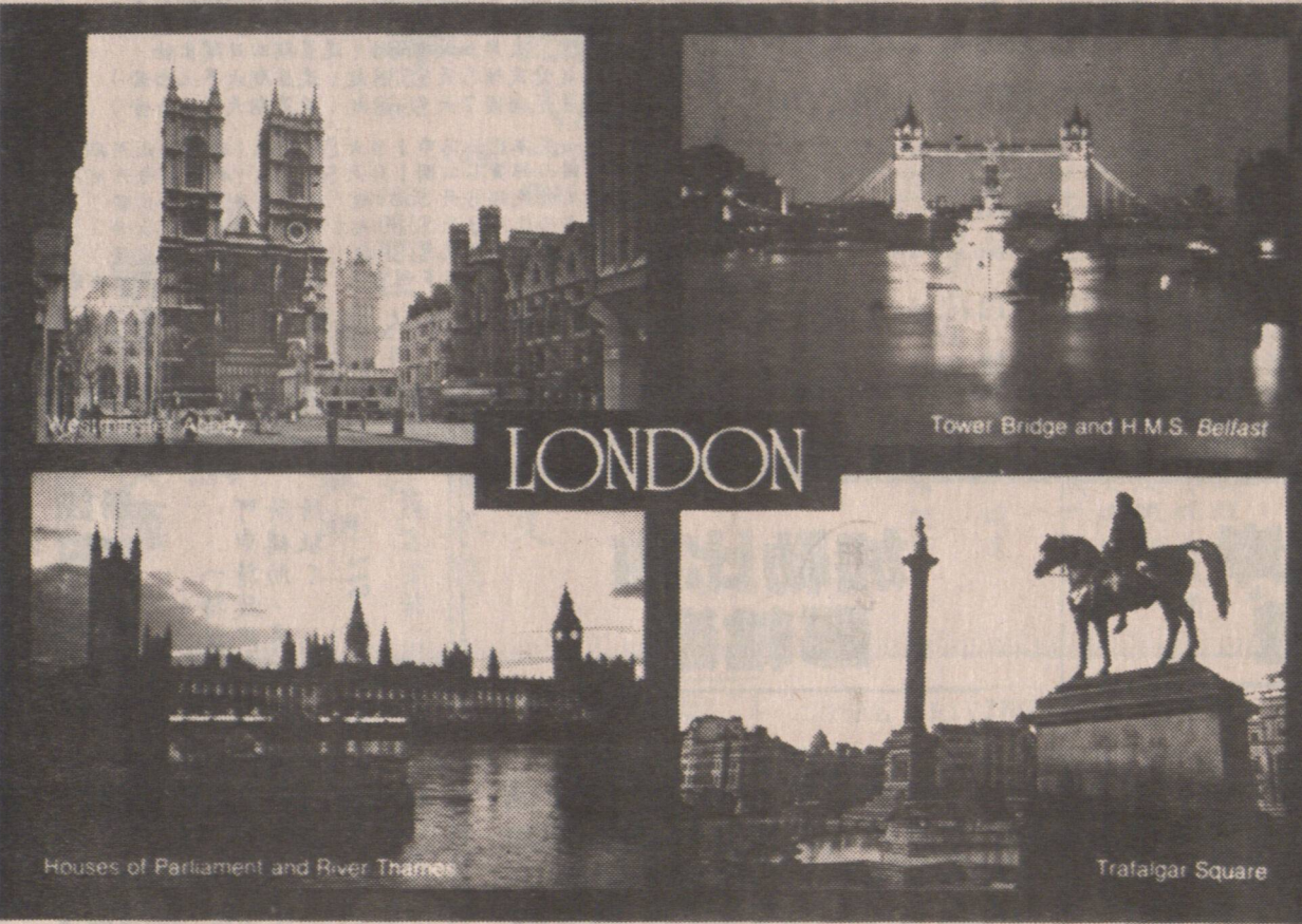
△ 西敏寺(上) 國會大廈,大笨鐘和太晤士河(下)