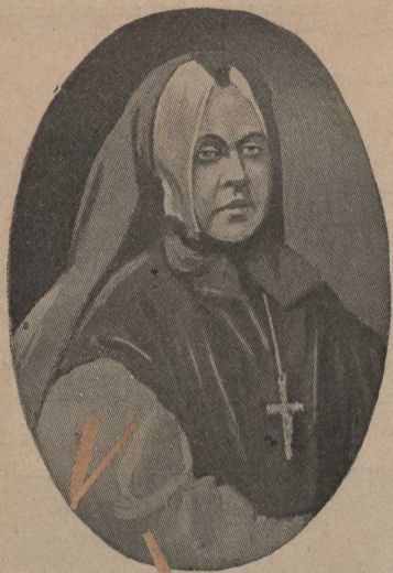
Révérende Mère E. Bruyères, fondatrice de l'Institut des Sœurs Grises, d'Ottawa.

deuil, dans leur voile noir, l'orgue, touché par une main habile, soupire les plus doux accords et une voix vraiment céleste faisait entendre un chant qui semblait avoir emprunté aux anges sa mélodieuse et pénétrante douceur.