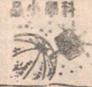
人類利用太陽能的歷史悠久，根據記載，最早利用太陽能的是古埃及人。

人類利用太陽能的歷史悠久，根據記載，最早利用太陽能的是古埃及人。在幾千年前，「淮南子」就記載：「積陽之熱氣生火，火氣之精者為日，故陽燧見日，則然為火。」遠在周朝時期，一種名為「陽燧」的銅製一聚光鏡，就被專門用來反射太陽光，使水而生火。這種中間凹的銅製「陽燧」，就是今日利用太陽能的「聚光鏡」最早的原型。 到現代，自六十年代起，世界各國加強了對太陽能利用的研究，並取得了初步的成果。最近，美國加州建成一座世界最大的太陽能發電廠，稱「太陽能一號」，它佔地七十英畝，反射鏡有一萬四千多面，把陽光聚集在場中央四十五度的金屬圓柱上，只要數分鐘，圓柱上就可產生七百度的高溫蒸汽，來推動汽輪發電機轉子而發電。一萬千瓦的電力，足可供應五千個家庭的用電量。據稱，到一九八八年，美國還將建成一座發電量達十萬千瓦的太陽能發電廠。