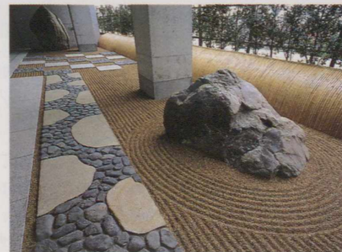
カナダ・ガーデンの日本庭園(4階)。