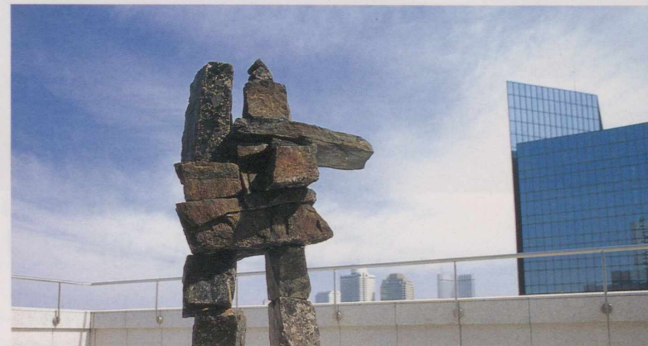
カナダ・ガーデンに立つイヌットの彫刻「イヌクシュック」。