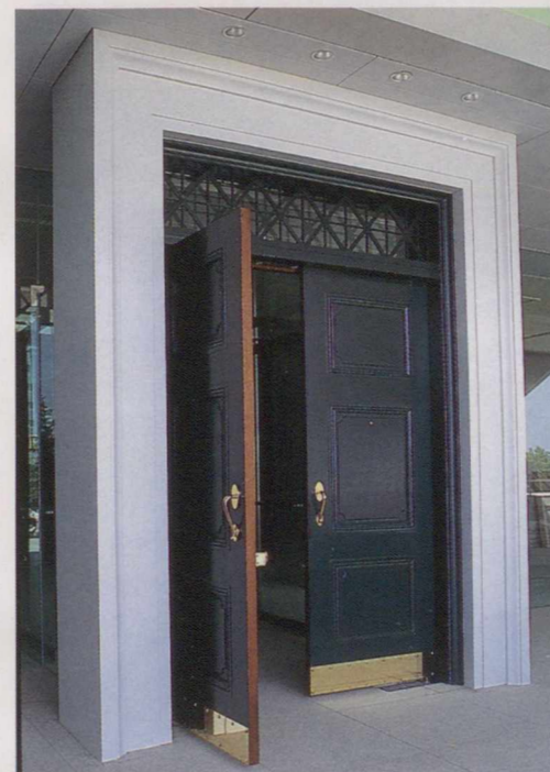
4階正面玄関の扉と明かり取り窓は、1930年代に建てた前庁舎のものを使ってある。