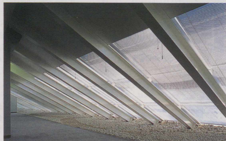
外光をいっぱい採り入れた7階の廊下。

同じ4階には、「大西洋」に面して、特別ゲスト用のダイニングルームもおかれている。