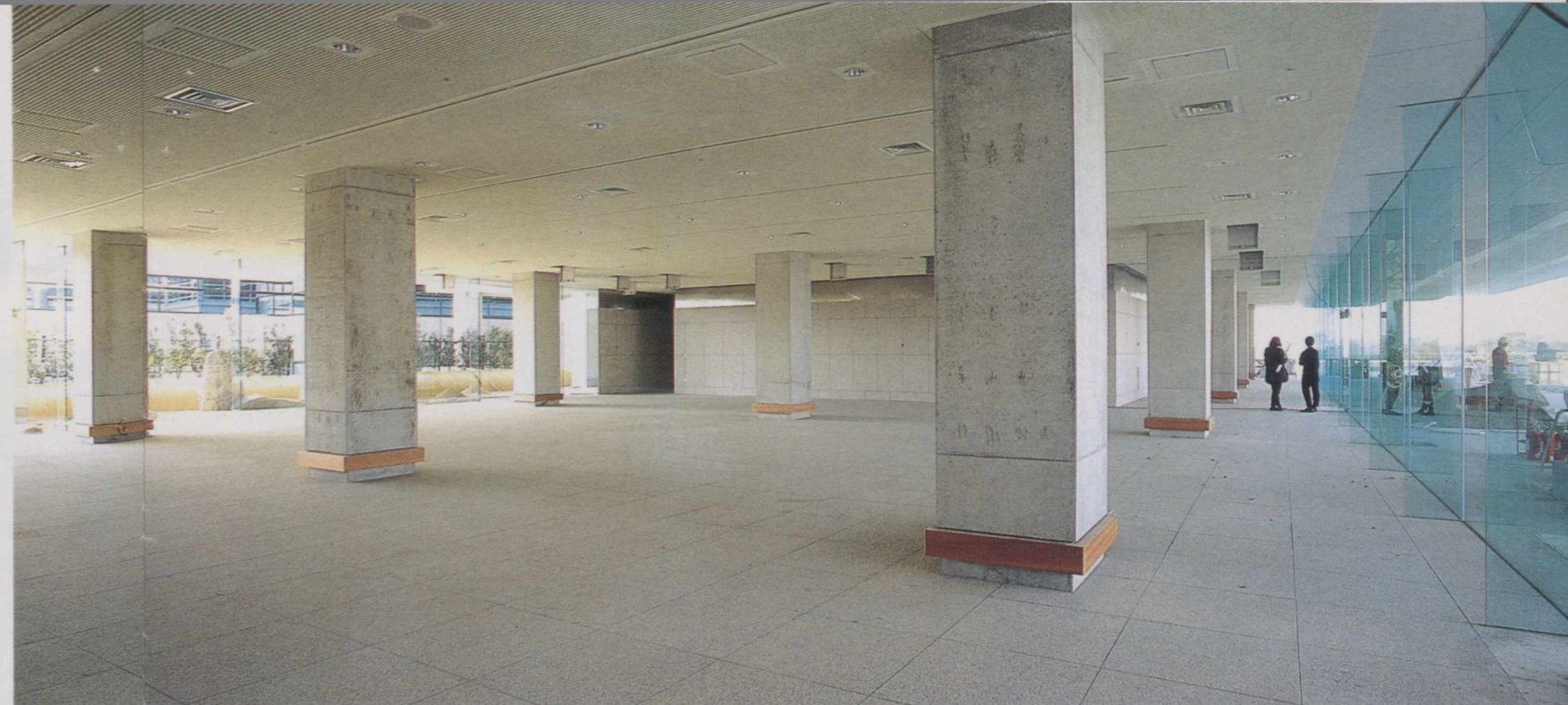
4階のエキシジション・スペースは、四方がガラス張り。