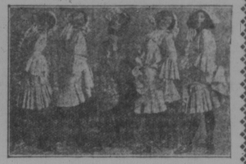
Die Gotta-Mädchen von der Parker-Schau auf der Provincial Ausstellung, 2., 3., 4. und 5. August.

Pferdrennen, Automobilen, Zuchtstierpreise, außergewöhnliche Preise. Große Attraktionen.