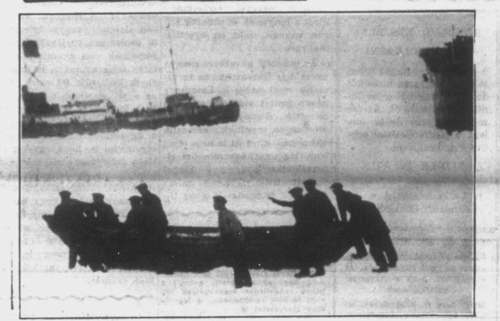
A Newfoundland melletti Horse sziget közelében felrobant „Viking” nevű fókavadászhajót és a megmenekültek egy részét mutatjuk be képeinken. Alul a Southam Press Syndicate egyik drámai erejű felvétele lát-ható, mely a sebesülteknek a mentőhajókra való szállítását ábrázolja. Az örökre eltűnt ál-dozzatok számát 28-ra becsülik.

KISFIU SZÜLETETT A VILLAMOSON és mire a kórház bejártánál megállította a kocsit a vezető, úgy az anyja, mint gyermeke a legjobb egészségben hagyták el a villamost, hogy az orvosai megvizsgáltassák magukat.