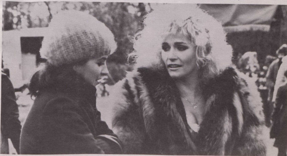
Annie Potts (izquierda) y Margot Kidder en la película Heartaches.

La comisión identificó 15 áreas en que se podrían emprender proyectos conjuntos, intercambios, misiones y seminarios. Las delegaciones concurren en que se debiera dar prioridad al espacio (detección remota), energía (conservación energética, en particular) oceanografía (robóticas para aparatos submarinos), biotecnología e información científica.