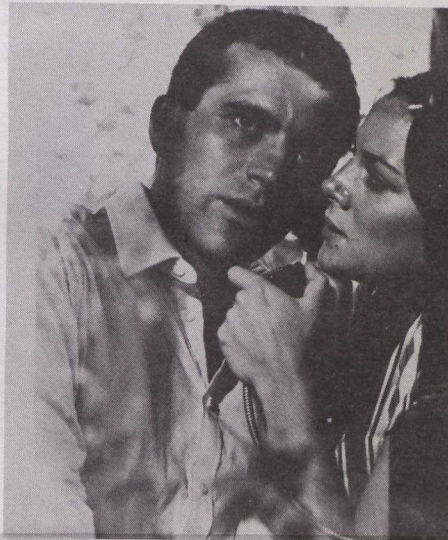
Nick Mancuso estrella de Ticket to Heaven.

Además de la ceremonia de entrega, el mismo día se celebraron dos recepciones importantes. A las festividades acudieron Peter Ustinov, Mariette Hartley, Glenn Ford y Gale Garnett.