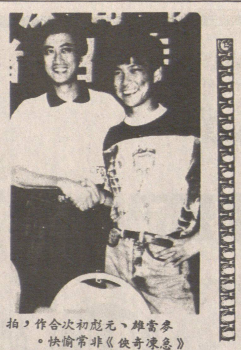
拍，作合次初元、維魯多

香港三立公司與台灣財團合作，預計每年拍攝二十至五十部影片。這項合作旨在加強兩地影視業的交流與合作，並為觀眾提供更多優質的影視作品。