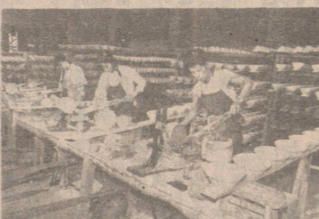
丙村日用瓷廠一車間