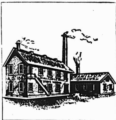
En l'année 1864

Nous nous sommes ardemment efforcés depuis près de soixante ans de mettre à la disposition du public en général une ligne de marchandises que nos agents puissent consciencieusement recommander et libéralement garantir comme un produit du plus grand mérite.