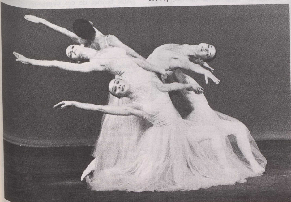
Sérénade, par les Grands Ballets canadiens. Chorégraphie de George Balanchine.

* CEGEP: Collège d'enseignement général et professionnel.