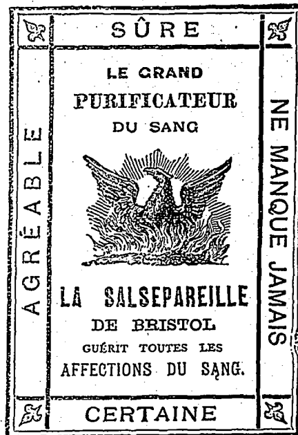
L'ancien Prix Populaire 25c.