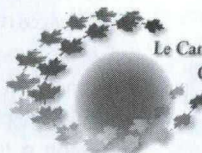
Le Canada au Japon Canada in Japan

S t. Lawrence Textiles, de Hawkesbury, Ontario, est une entreprise privée, établie de longue date qui fabrique, surtout pour l'exportation, des vêtements pour enfants, de la naissance à deux ans, ainsi que des vêtements de sport pour adultes. Il y a environ cinq ans, la haute direction a décidé d'explorer le marché japonais et a confié à un représentant sous contrat d'exclusivité, Mockingbird Trading Co., la tâche de promouvoir les articles fabriqués par l'entreprise auprès des jeunes familles japonaises attirées par les produits différents, haut-de-gamme et qui ont du style.