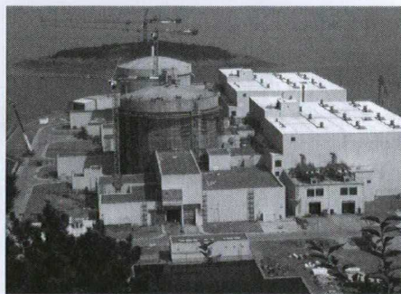
Vue de Qinshan III : le deuxième réacteur au premier plan et, à l'arrière, le premier réacteur.

La centrale CANDU de Qinshan est le plus important projet d'infrastructure à participation étrangère réalisé en Chine, et les travaux de la première tranche ont été accomplis