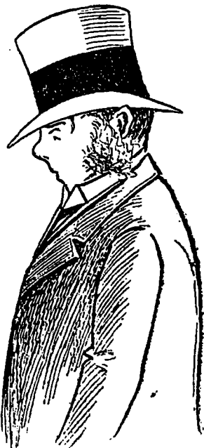
Le personnage mystérieux

Le lendemain de la visite du docteur Coxis chez le comte de Bouctouche, un personnage mystérieux se promenait