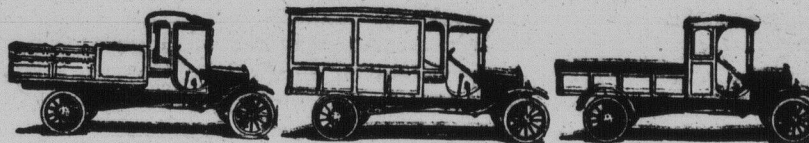
Trois des nombreux genres de carrosserie dont peut être muni le châssis du camion Ford.