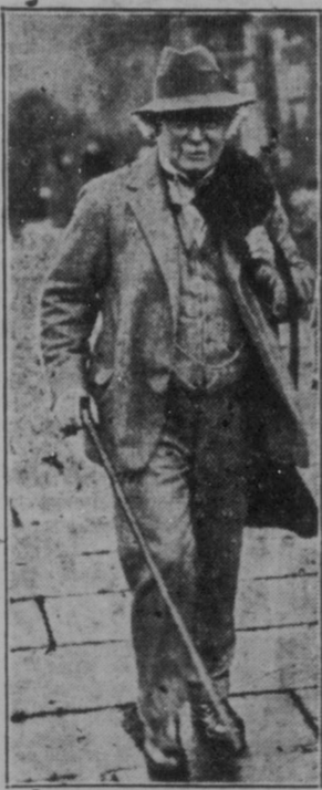
David Lloyd George.