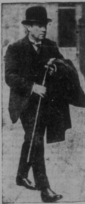
Stanley Baldwin går

Den nya regeringen får ge- nast sitt tillträde två svåra nötter att knäcka, nämligen av- rustnings- och arbetslöshetsfrå- gorna.