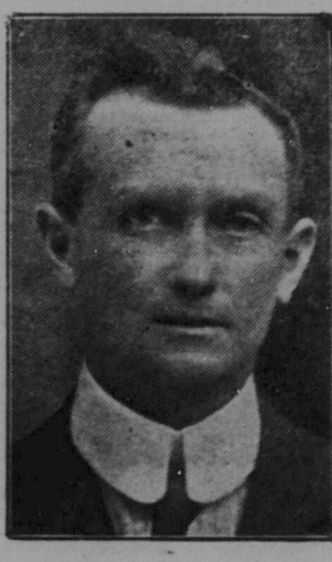
Förre finansminister F. V. Thorson, som framlade de progressiva resolu- tion om Hudson Bay banan.

Förre finansminister F. V. Thorson avled den 5 maj i Stockholm efter att nyligen ha genomgått en operation. Han hade varit sjuk alltsedan i höstas. Herr Thorson blev för en kort tid sedan vald till Hjalmar Brantings efterträdare såsom ledare av det socialdemokratiska partiet. Han var till yrket skomakare samt här- sammade från Tetad, i vilken stad han fört hade en del kommunala för- trolleuppdrag, innan han kom in i riksdagen. Han specialiserade sig tidigt på finansiella frågor samt var bankfullmäktigt och gjorde sitt första inträde i kabinettet som finansmin- ister, vilken post han sedan beklädde 1920 samt 1921-23. År 1920 var han även en del handelsminister. Vid sitt frånfråle var han 60 år gammal. Med Thorson bortgår en dugande man, som länge intagit en framstående plats inom arbetarpartiet och inom de politiska kretsarna. Åter har en klanpa av Hjalmar Brantings regim skördats av lifemannen.