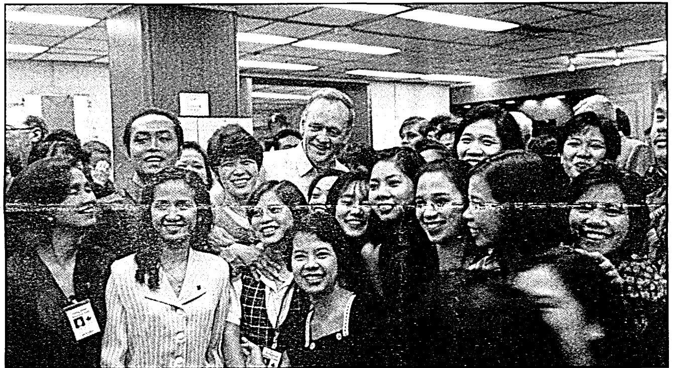
Le premier ministre Chrétien rencontre de jeunes membres du personnel de l'ambassade du Canada à Manille qui ont aidé la délégation canadienne lors de la récente réunion des dirigeants des économies de l'APEC.