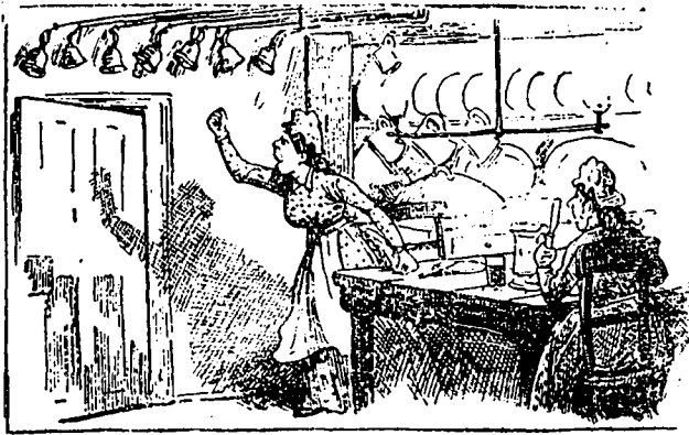
(Le Vendredi Saint)

La cuisinière. — Ah ! ils disent que les cloches sont parties pour Rome ! Il n'y a pas de danger qu'elles y aillent les cloches des protestants. Regardez : elles ne s'arrêtent pas une minute, ces sommettes de malheur !