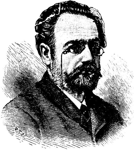
M. EMILE ZOLA ROMANCIER

La ligne, par insertion - - - - 10 cents Insertions subséquentes - - - - 5 cents Tarif spécial pour annonces à long terme