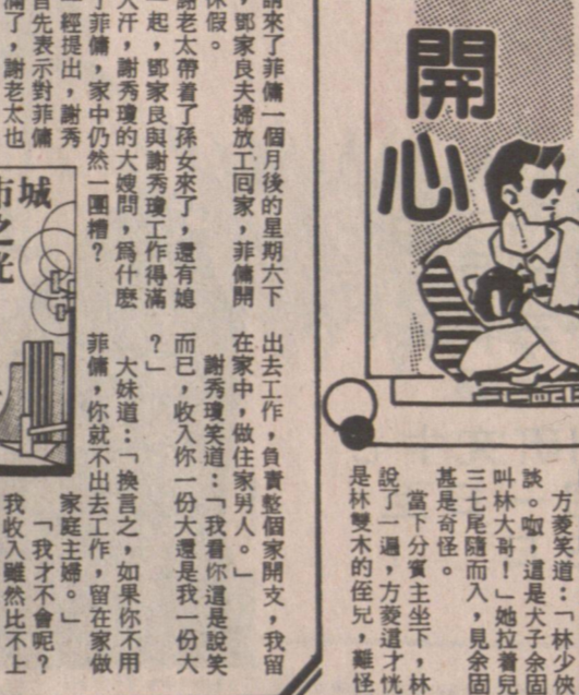
Caption for the illustration.