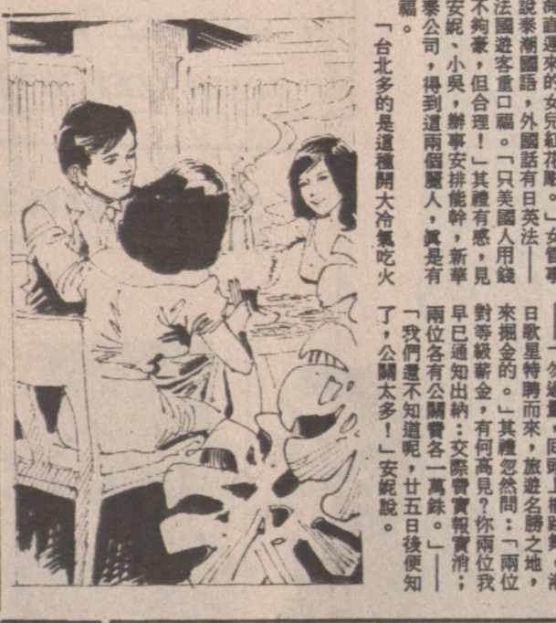
Caption for the illustration.