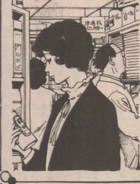
Caption for the illustration.