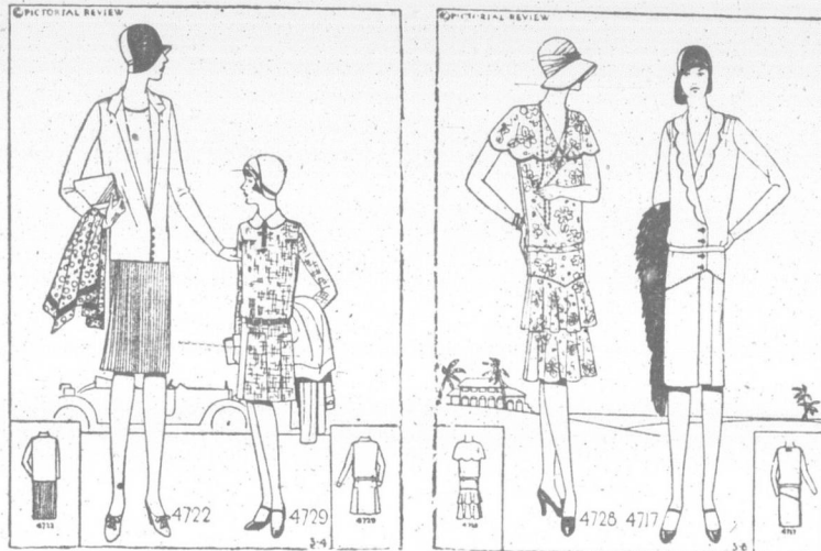
COSTUME DE RUE