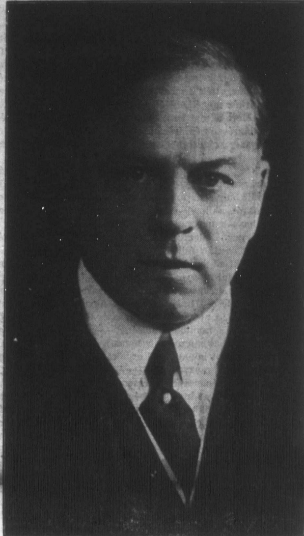
Jobboldalon a volt birodalmi miniszterelnök: HON. W. L. MACKENZIE KING