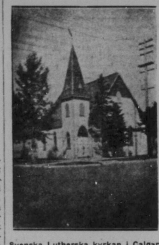
Svenska Lutherska kyrkan i Calgary, Alta.