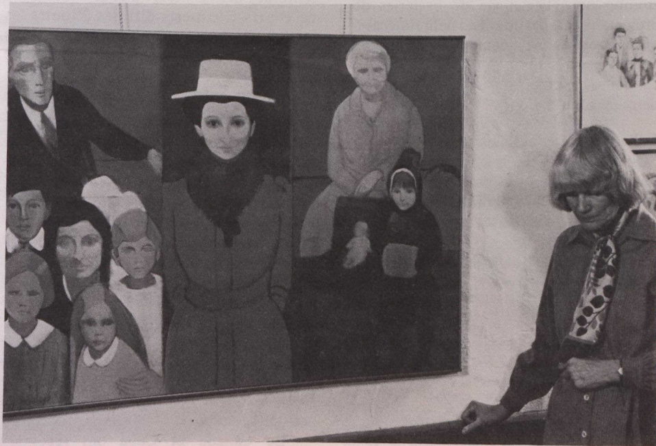
Photo tirée du film La Toile d'araignée , production de l'Office national du film.

Documentaire fouillé sur le milieu des arts au Québec en 1979, collection d'art vivant où les oeuvres s'entremêlent, en un langage étonnant, à la réalité qui est leur source, fresque d'artistes et d'artisans qui se penchent sur leur art et leur vie, La Toile d'araignée est une oeuvre d'art cinématographique finement ciselée, dont la forme épouse intimement le contenu.