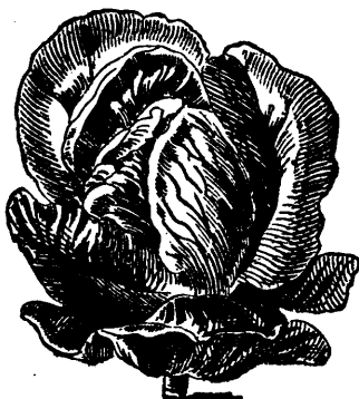
27. GROS HATIF DE YORK.