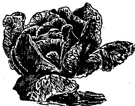
28. CHOU DORÉ DE SAVOIE.

Culture. —Ces graines pourront être plantées après le milieu de Mai parmi le blé d'Inde, ou dans les champs ou le jardin, dans des fosses espacées de dix pieds en tous sens; laissez trois ou quatre plants par fosse. Cultivez comme pour les melons et les concombres, mais évitez de les planter près de ces espèces.