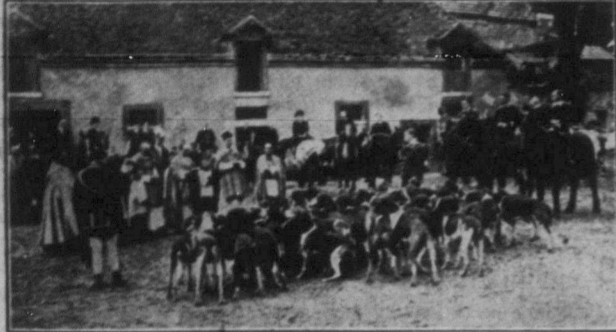
BLESSING THE FOKHOUNDS IN PARIS In accordance with custom, the opening of the hunting season in France was marked by the ceremony of blessing the hounds, which took place at the meet of the St. Hubert pack in Paris.

також рідшили не брати зі своїх парафіян, а розкоши покривати зі своїх рістейтських бізнесів. Сам Брукс що невідомо в цій церкві проповідує слово боже. І американські газети пишуть, що церква в неділю ввечерям переповнена парафіянами. Зйдуться парафіяне, посядають в гойданках і погойдуються слухають проповіді рістейтніка. А його спільники Браєна зробили навіть толовою міста Гейнс. Так то два хитри християнські бізнесмени зуміли сполучити свій рістейтський бізнес з релігією.