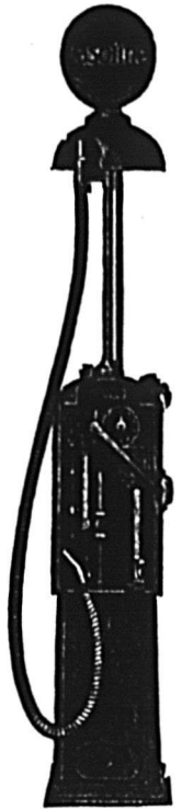
Fig. 241. Pom- pe à gazoline "Sentinelle Rouge".