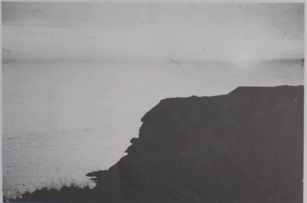
Avondschemering, Nationaal Park "Prince Edward Island"