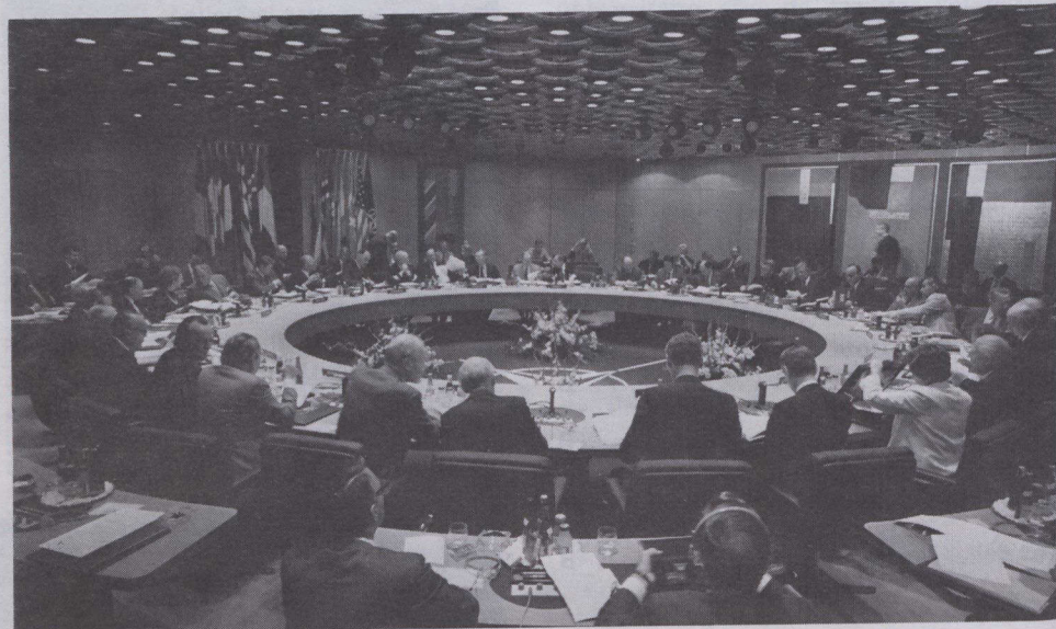
Réunion des chefs d'État ou de gouvernement des 16 pays membres de l'OTAN.

leader du Parti socialiste ouvrier espagnol (PSOE), M. Felipe Gonzalez.