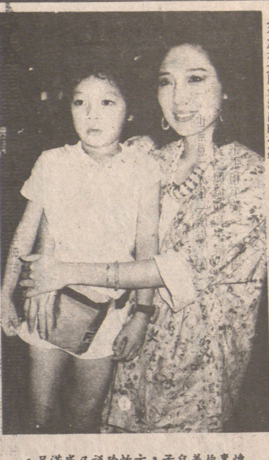
足滿感已說珍怡方，子兒着抱懷懷

港返帶被昨台由命遵子兒，港返帶被昨台由命遵子兒，港返帶被昨台由命遵子兒。港返帶被昨台由命遵子兒，港返帶被昨台由命遵子兒，港返帶被昨台由命遵子兒。