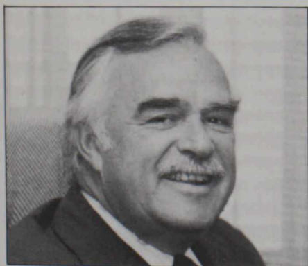
M. John Robarts, coprésident de la Commission de l'unité canadienne, a été premier ministre (conservateur) de l'Ontario.

entre le gouvernement fédéral et les gouvernements provinciaux et dans le domaine des institutions. Sur le premier point, elle demande un effort de clarification (la dévolution des compétences n'est pas toujours claire) et d'adaptation aux réalités. C'est là que la commission reconnaît le caractère « unique » de la position du Québec, seule province « ayant une communauté linguistique en situation minoritaire dans l'ensemble du pays et majoritaire à l'intérieur de ses propres frontières ». Le Québec « devrait détenir les pouvoirs nécessaires à la préservation et au développement de son caractère distinct au sein d'un Canada viable » (3). « Toute solution politique qui ne répondrait pas à cette attente signifierait l'éclatement du Canada ». Dans le domaine des institutions, la commission recommande en particulier le remplacement du Sénat par un Conseil de la fédération dont les membres seraient délégués par les provinces (4). L'assemblée serait compétente dans les domaines législatifs qui sont communs, à divers titres, au fédéral et au provincial. D'autre part, la composition de la Cour suprême devrait mieux refléter la dualité canadienne sur le plan juridique (droit civil et common law ). Les propositions de la commission portent encore sur une réforme de la loi électorale qui viserait à ajouter une certaine dose de proportionnalité au système majoritaire à un seul tour.