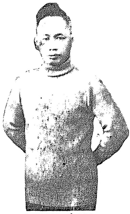
（衫領罇） 由胸前橫量 至脅後書明 若干英寸付 來無悞

本公司在雲高華開張織造男女各款最好羊毛襪結工夫精 良久爲僑胞歡迎蓋本公司所織造之襪結專取合中國人身 材尺度適合非比西人所造之衫有袖長及不襯身之憾而且 價極廉平