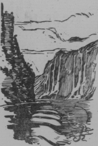
DIE „SIEBEN SCHWESTERN“ IM GEIRANGERFJORD

Von Hellefält nach Sie am Norangsdal führt der Weg durch das wildzerklüftete Norangsdal. Viehtrieb, über die Wand der Felsen. Zur Not zählt man alle sieben, wenn genug Wasser da ist. Denn meist trocken im Sommer drei bis vier davon aus — sie seien verheiratet. Sagt der norwegische Volksmund. Der Geirangerfjord ist einer der schönsten Fjorde in ganz Norwegen. Eine unbeschreibliche Stimmung liegt über dem tiefgrünen Wasser und den engen Bergwänden des Fjords, durch die wir gleiten. Tägen wir Bilder dieser Stimmung, in tiefen Farben bunt gemalt — wir würden es als stillschweigend. Hier aber überwältigt uns die unverfälschte Schönheit der Natur.