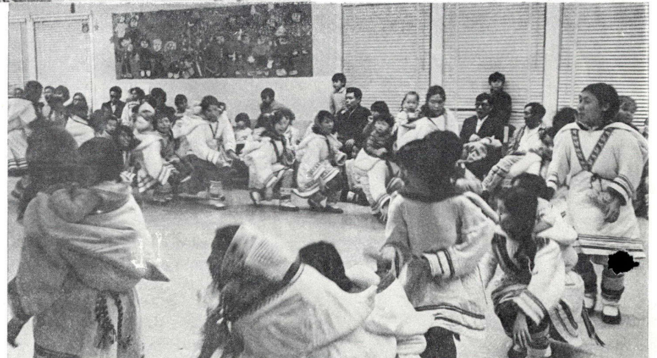
Les jeux et les danses sont des éléments essentiels des festivités de Noël.

J'aimerais réentendre les cantiques que nous chantions lorsque j'étais jeune et que j'avais encore une famille."