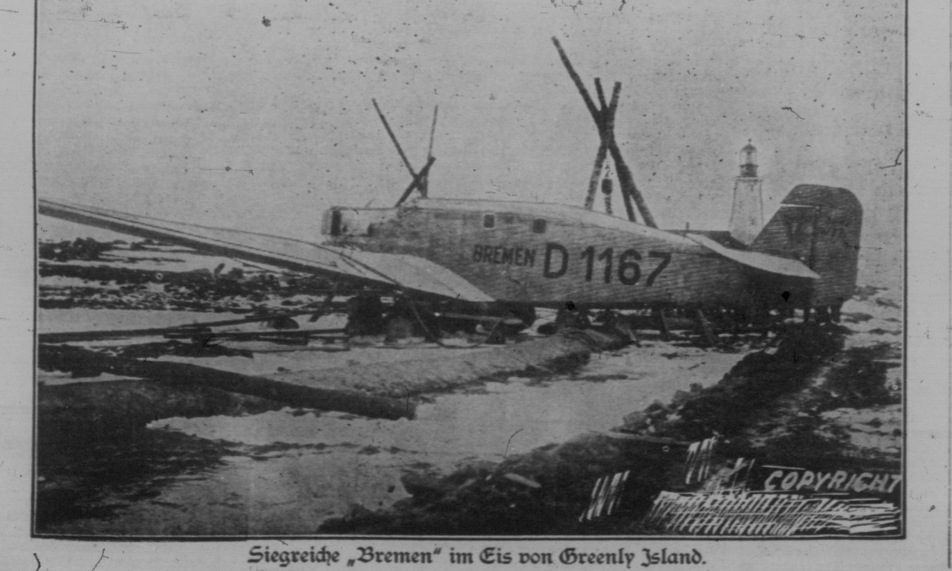
Siegreiche „Bremen“ im Eis von Greenly Island.