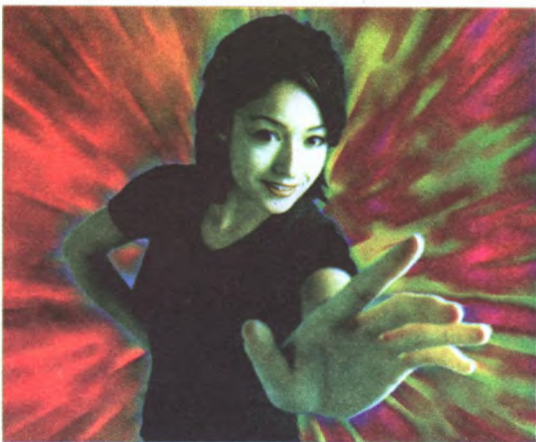
Affiche officielle de la conférence : Cherchons l'Asie

Les délégués avaient fait leurs bagages et étaient prêts à partir, mais les inondations provoquées par la crue de la rivière Rouge ont forcé les organisateurs à repousser de la date originale en mai jusqu'au 28 septembre - 5 octobre la tenue de cet événement. C'est alors que devraient se rencontrer des jeunes du Canada et de l'Asie pour discuter de leur avenir commun au sein d'une communauté du Pacifique. Cherchons l'Asie sera lié par téléconférence à 12 autres endroits au Canada.