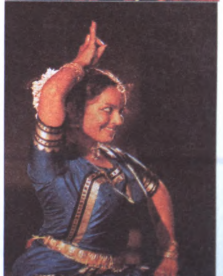
Folklorama présente annuellement un grand nombre d'artistes asiatiques.