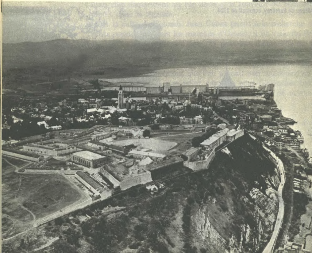
Vue de Québec: la Citadelle et les Plaines d'Abraham.

Le régime français au Canada dura jusqu'en 1760. Soumise au gouvernement royal, la colonie était gouvernée par un conseil souverain, nommé et dirigé par le Roi. Les principaux fonctionnaires étaient le Gouverneur, qui assurait la défense, l'Intendant,